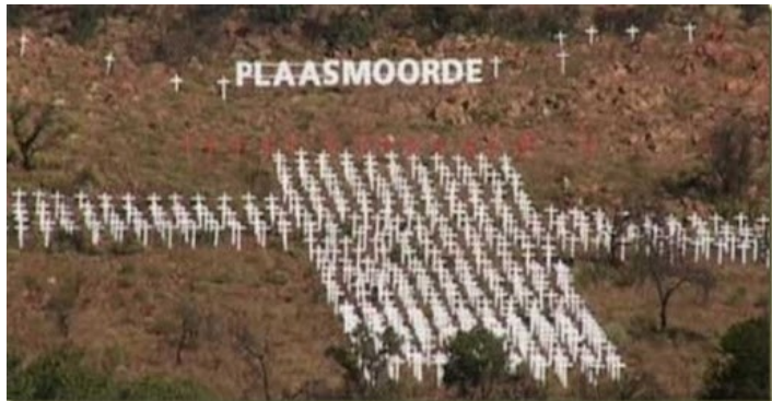
Monumento en Pietersburg a los granjeros blancos asesinados.

El genocidio bóer o genocidio afrikáner es un proceso de limpieza étnica y exterminio físico y sistemático contra el pueblo blanco afrikáner en Sudáfrica , desde 1994 hasta la fecha, perpetrado por el gobierno marxista del Congreso Nacional Africano (ANC) con complicidad de la comunidad internacional y silenciado o minimizado por los medios de comunicación. Este genocidio se ha llevado a cabo tanto por medio de ingeniería social como por medio de asesinatos y matanzas. El llamado Plaasmoorde (en afrikaans "asesinato de granjeros") constituye la parte más violenta del genocidio contra la población bóer, en la cual se estiman algo más de 3.000 granjeros blancos asesinados, mientras que el total de las víctimas varían entre 35.000 y 70.000 blancos [1] . Los ataques no atienden a cuestiones de edad o sexo.